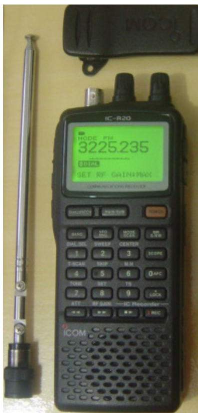
il vecchio IC R20

Si potrebbe cominciare con il decisamente l'intramontabile Icom IC-R20 o il nuovo modello IC-R30 (non so se già in commercio).